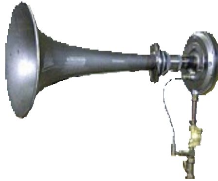
Sonoforce IKT 230/170 (Duyulabilir ses)