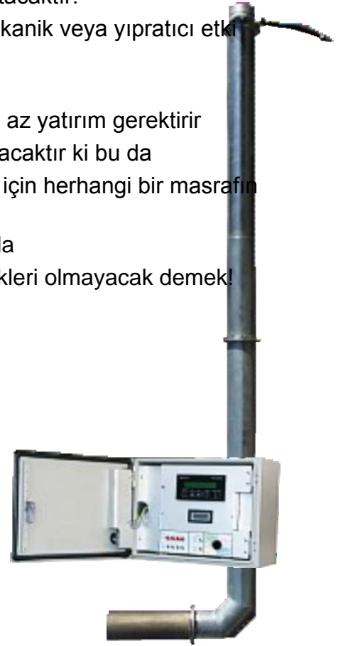
INSONEX 200 G (Ses ötesi)