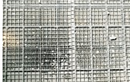
Sonik Temizleme işlemi yapıldıktan altı ay sonra SCR