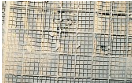
Sonik Temizleme işlemi olmadan altı ay sonra SCR